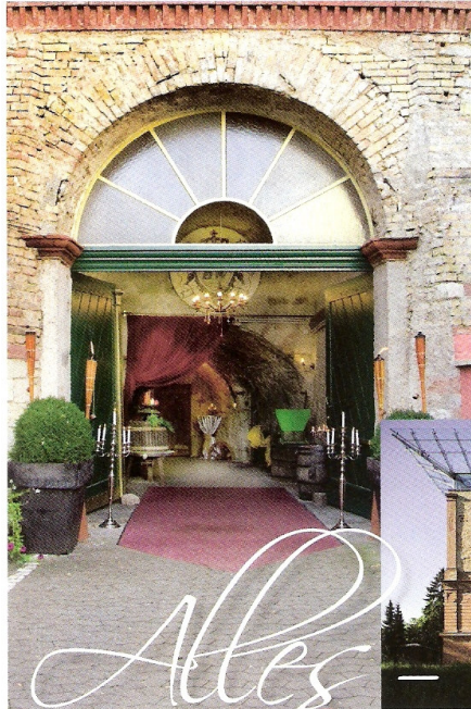
Gewölbekeller der Burg Weisenau

Feiern im Oldtimer-Museum, tagen in der größten Burg- ruine Deutschlands – oder vielleicht auch mal ein rich- tiges Schloss mieten? Alles, außer gewöhnlich zu sein, versprechen einige Veranstaltungsorte in der Region nicht nur, sie sind es auch. Glauben Sie nicht? Dann überzeugen Sie sich doch selbst: Bei der „LOCATIONS Rhein-Main“ am Freitag, 30. Oktober, in der Alten Lok- halle Mainz (Mombacher Straße 78 – 80).