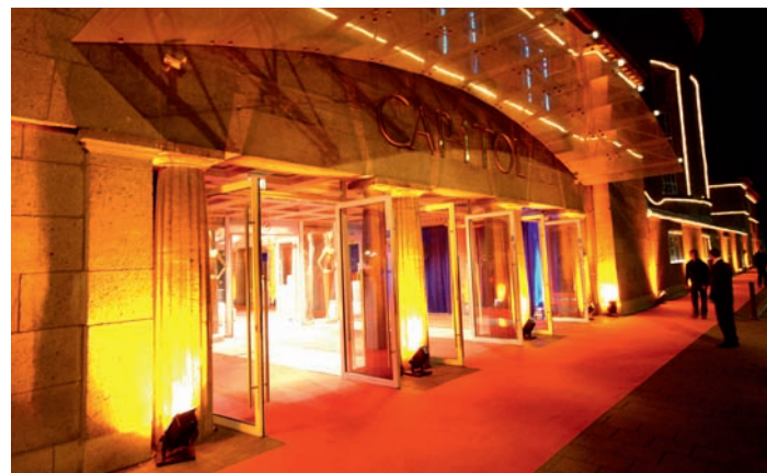
Capitol Theater Offenbach

Nationalsozialisten die Synagoge für ihre Versammlungen und Kundgebungen. Als die Offenbacher Juden nach dem zweiten Weltkrieg zurückkehrten, war ihr Gotteshaus entweiht. Gemeinsam mit der Stadt Offenbach beschloss man daraufhin die öffentlich-kulturelle Nutzung. Das Stadttheater wurde gegründet und zog in das geschichtsträchtige Gebäude ein. Fortan bot man im Capitol Theater ein klassisches Programm von Schauspiel bis Oper bis das Haus in den 80er Jahren, bankrott und marode, geschlossen werden musste. Ein privater Unternehmer sanierte das Gebäude und baute es zu einem Musical-Haus um, das mit dem The Who-Musical „Tommy“ Of-